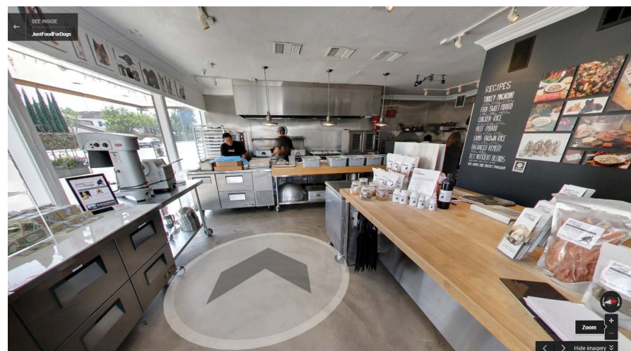
Zdjęcia Business View otwartej kuchni w firmie Just Food For Dogs w Newport Beach w Kalifornii

Rudy Poe, partner zarządzający, Just Food For Dogs