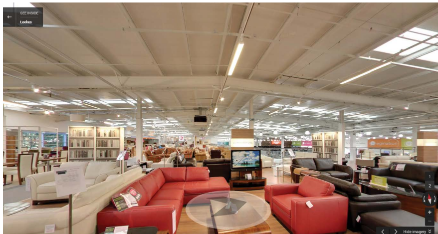
Zdjęcia Business View w sklepie Leekes w Coventry.